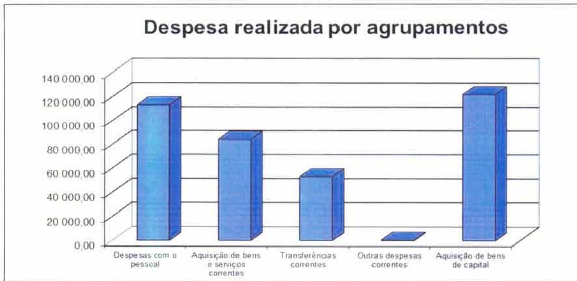
Gráfico n.º 2