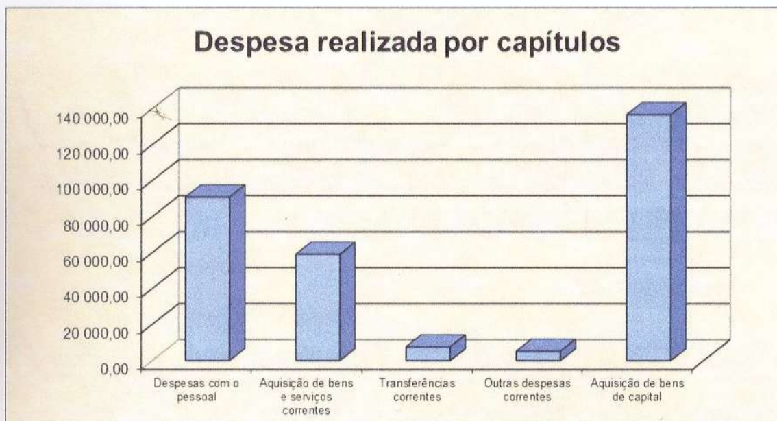
Gráfico n.º 2