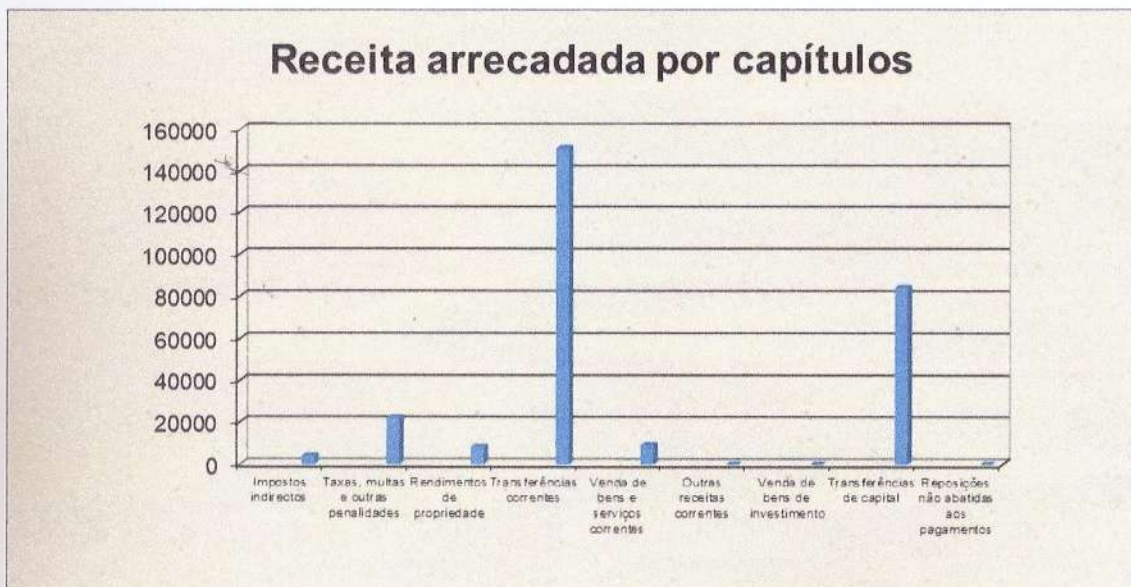
Gráfico n.º 1